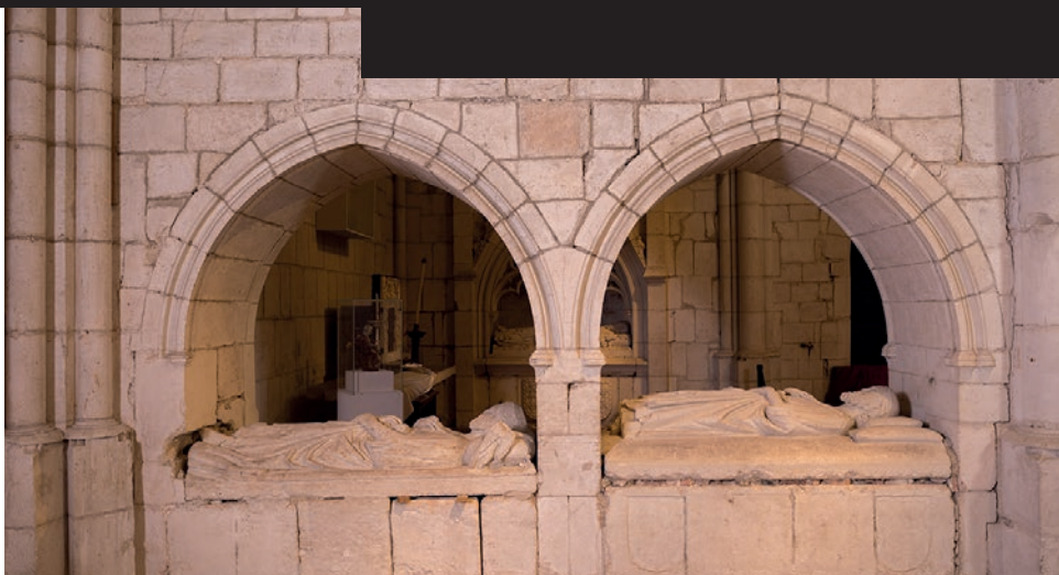
Fotografía de los sepulcros en la actualidad, en el brazo sur del transepto.

LAHOZ, Lucía M.ª "Sepulcros góticos de la catedral de Vitoria". Cuadernos de Sección, Artes plásticas y documentales, 11, 1993, pp. 73-91.