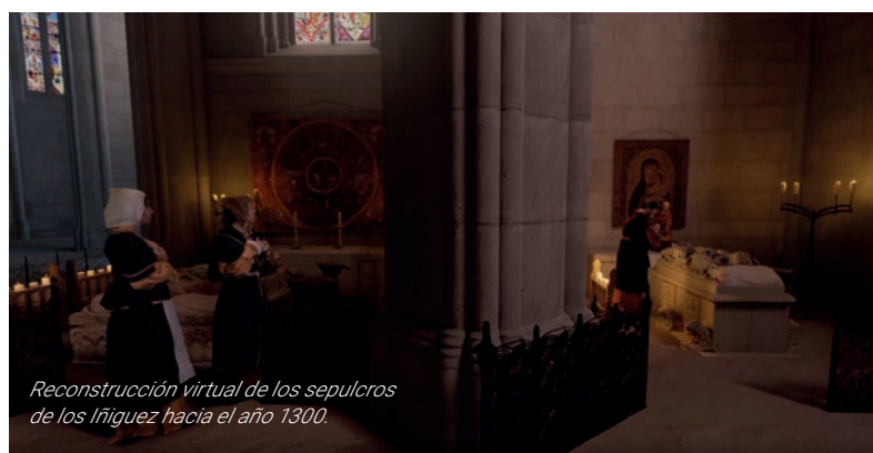
Reconstrucción virtual de los sepulcros de los Iñiguez hacia el año 1300.